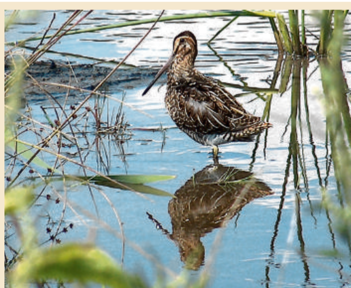
Die Tarnung der Bekassine ist für den Riedboden gedacht.